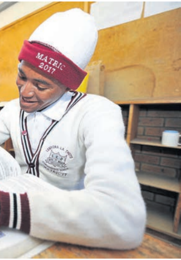
studie te doen. Hy is een van die slaap om sy punte te verbeter.