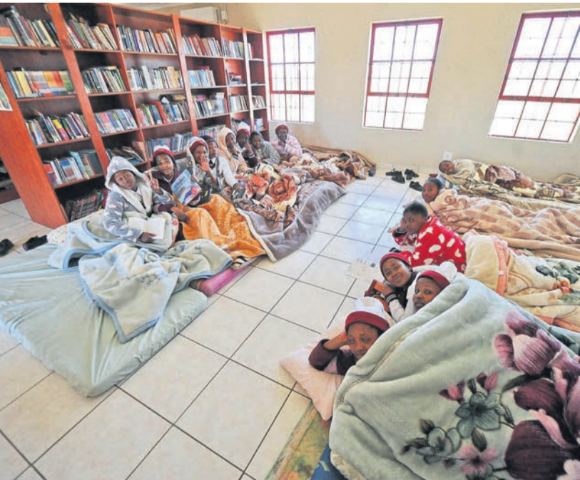
Van die meisies wat in die skool se biblioteek oorslaap, lê ingeryg soos sardientjies. Maar hulle gee glad nie om om so te slaap nie. "As dit ons punte verbeter, hoekom nie?"