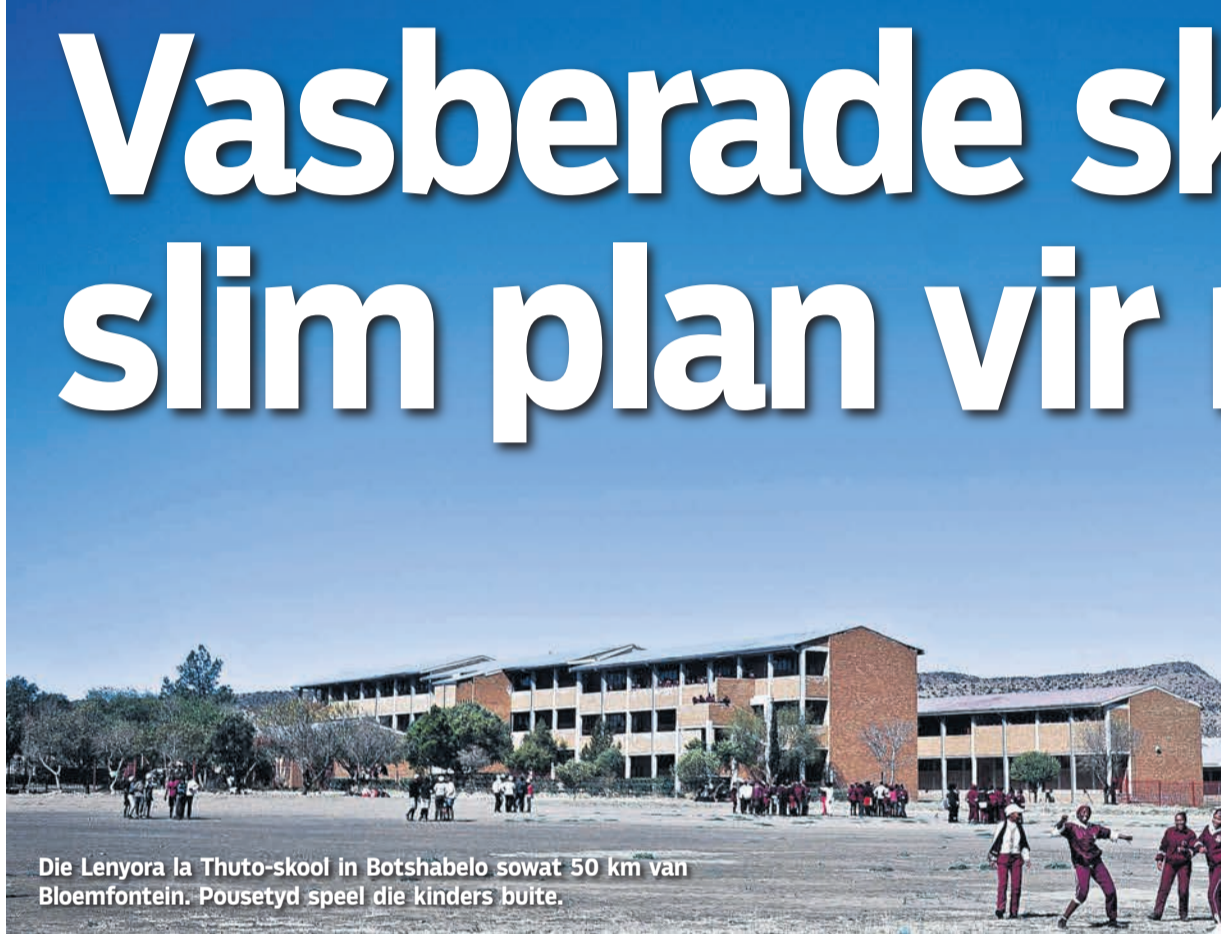
Die Lenyora la Thuto-skool in Botshabelo sowat 50 km van Bloemfontein. Pousetyd speel die kinders buite.

S ommer in die klasse lê die leerlinge op matrasse. Die seuns in die motorwerktuigkunde-klas en die meisies in die biblioteek.