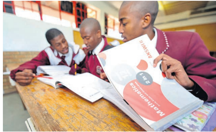
Die leerlinge help mekaar met 'n wiskundesom. Die leerlinge van die Lenyora la Thuto-skool in Botshabelo staan nie terug vir harde werk nie en sit meer as ekstra in om goeie punte einde vanjaar te behaal.